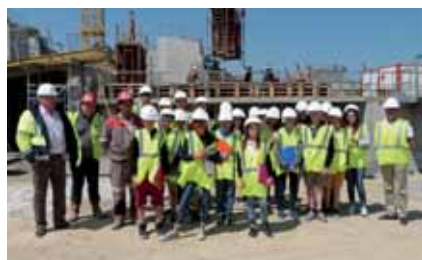
Visite au cœur du chantier pour des élèves de Sainte-Marie.

Près de la gare, la construction du Pôle d'échange multimodal se poursuit dans le respect du planning établi. Les équipes d'Eiffage terminent la partie parking à étages. Un parking de 607 places qui sera entièrement végétalisé.