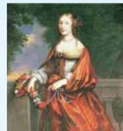
Madame de Sévigé, portrait réalisé par Jean Nocret (1644).

Les 19 et 20 septembre, à l'occasion des 32 e Journées européennes du patrimoine, les trois musées de Vitré ainsi que la tour de la Bridole sont accessibles gratuitement. Visites, libres ou guidées, pour tous.