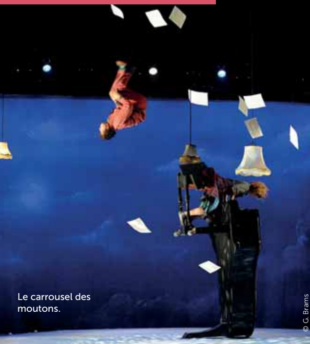
Le carrousel des moutons.