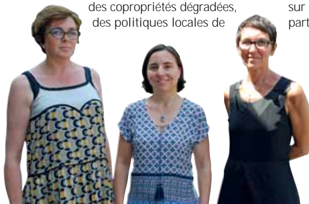
Le PIJ est transféré rue Notre-Dame.